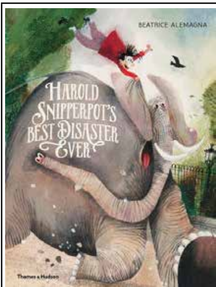
Іл.3. Беатріс Алеманья. «Harold Snipperpot's Best Disaster»

На світовому рівні цей напрям розвивають митці, які прагнуть виховати у дитини чуйність і здатність до емпатії через візуальну мову. Сідні Сміт, Девід Уокер, Ребекка Дотремер, Ян Кеббі, Анаска Аллепаз, Беатрікс Поттер, Софі Берроуз, Беатріс Алеманья, Каатъе Вермейре, Еліна Елліс, Бріоні Мей Сміт і можна ще довго перераховувати імена ілюстраторів, чії роботи, попри різні підходи до тем і техніки ілюстрації, сповнені метафоричності та емоційної глибини. Їхні книги вчать читача не боятися почуттів, помічати красу і виявляти турботу про інших. [6]